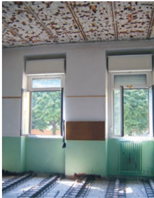
Consolidamento delle solette alla Scuola Bagatti

• scuola dell'infanzia - l'incontro è finalizzato ad un primo contatto nel quale vengono fornite solo le prime rudimentali nozioni di