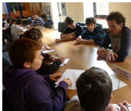
Alcuni momenti di lavoro del CCR per la raccolta delle informazioni sull'associazionismo locale e la definizione del layout della guida sulla città