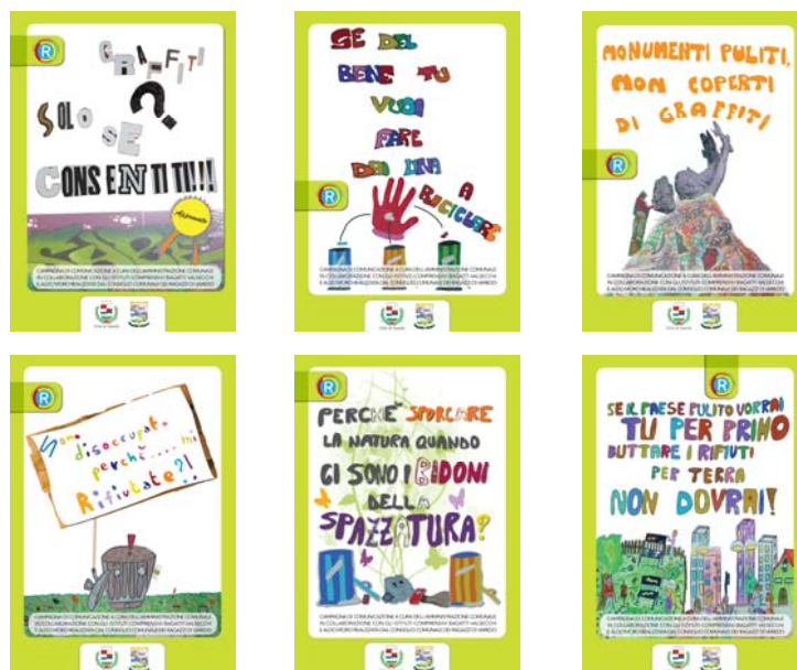
I manifesti realizzati dal Consiglio Comunale dei Ragazzi

Le attività del CCR hanno visto nel corso del tempo i rappresentanti misurarsi con diverse problematiche riguardanti la città ed il territorio. I consiglieri hanno contribuito ad esempio alla stesura di una campagna di comunicazione e sensibilizzazione sul tema del vandalismo, definendo il layout di manifesti diffusi su tutto il territorio comunale (annualità 2008 | 2009).