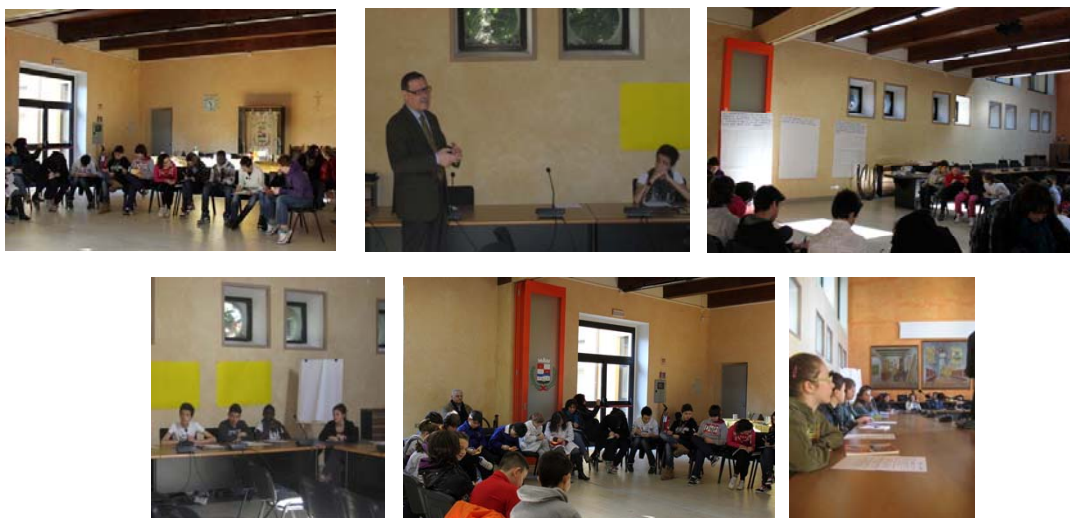
Alcuni momenti di lavoro del CCR per la definizione del documento di intenti per il futuro Consiglio Comunale dei Ragazzi

A seguito delle attività svolte i consiglieri del CCR hanno quindi elaborato un documento di intenti che raccoglie idee e spunti di lavoro per il futuro Consiglio Comunale dei Ragazzi.