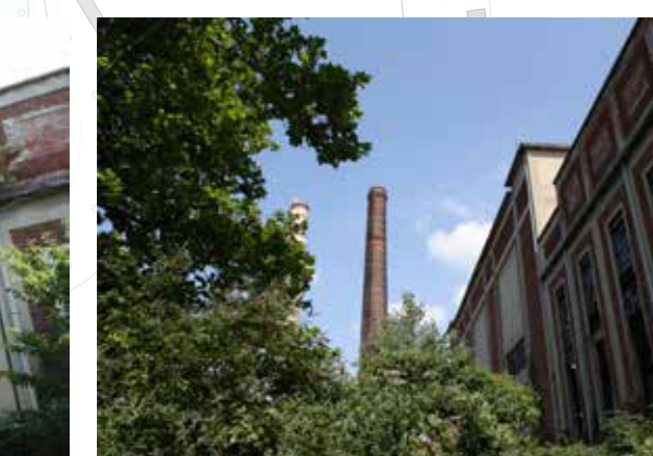
SETTORE EST_ Torri e ciminiere landmark