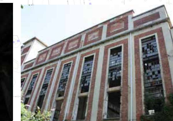
SETTORE EST_ Centrali elettriche Sviluppo verticale con richiami neoclassici