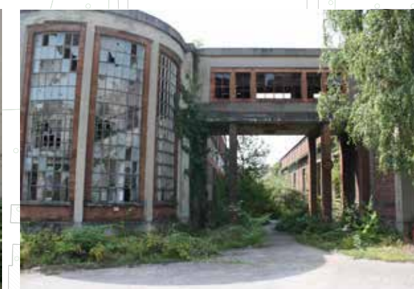
SETTORE NORD_ Corpo di testa stecca centrale Snodo distributivo Elemento vetrato