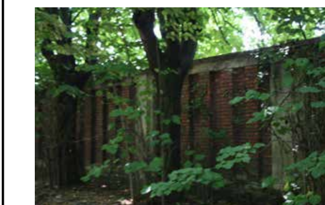
SETTORE OVEST_ Corpo di accesso settore sud ovest