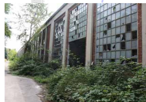
SETTORE B_ Fronte continuo facciata Elementi vetrati