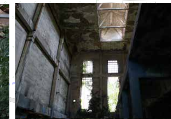
SETTORE A_ Interno ed. E. Soluzioni strutturali innovative Coperture con pregi storici