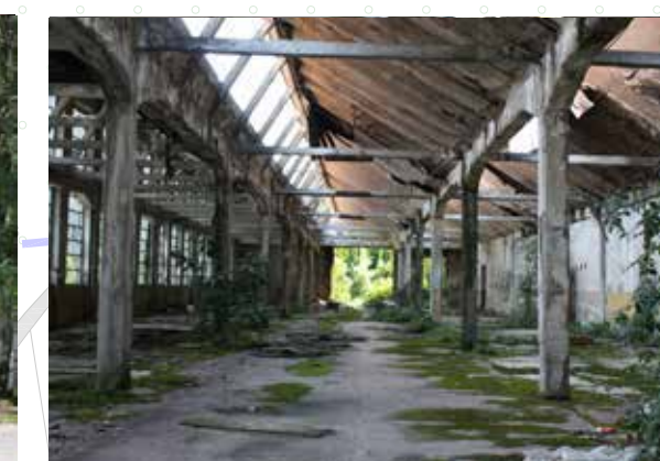
SETTORE A_ Primo settore industriale Elementi caratterizzanti del luogo