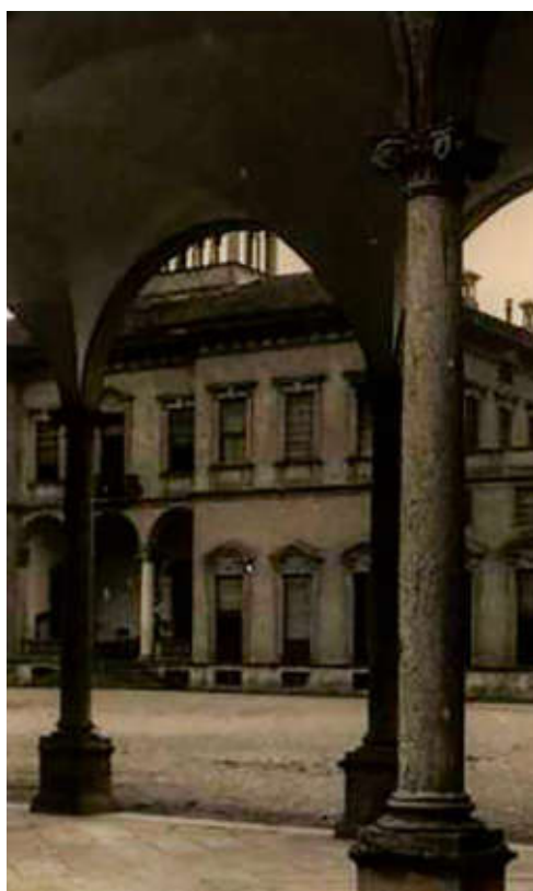
"Villa Bagatti Valsecchi - Portico ed ingresso della Villa"